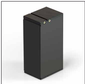
inklusive Akku GS 100 Der Akku kann über das Gerät aufgeladen werden