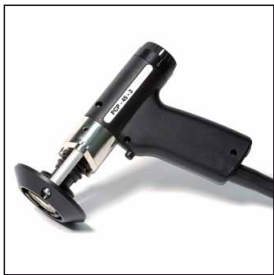
mit Pistole PCP 45-3 Massekabel (5 m) und speziell Magnetbolzenhalter